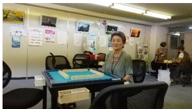
麻雀講座会場にて

回数をたくさんやっていくので、ある程度は上達したと思います。私としては上達したかどうかよりも、楽しいからやっているという気持ちです。